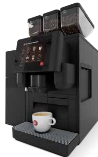
Skye Fresh Milk